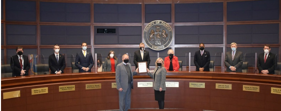
75a Feria Anual del País de la Iglesia Pohick