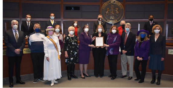
Asociación Conmemorativa Sufragista Punto de Inflexión